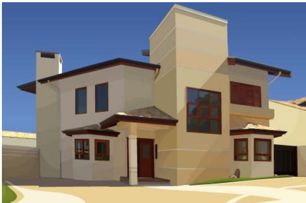
مدرنیته و معماری معاصر ایران