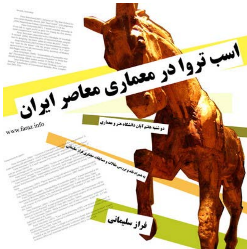
اسب تروا در معماری معاصر ایران