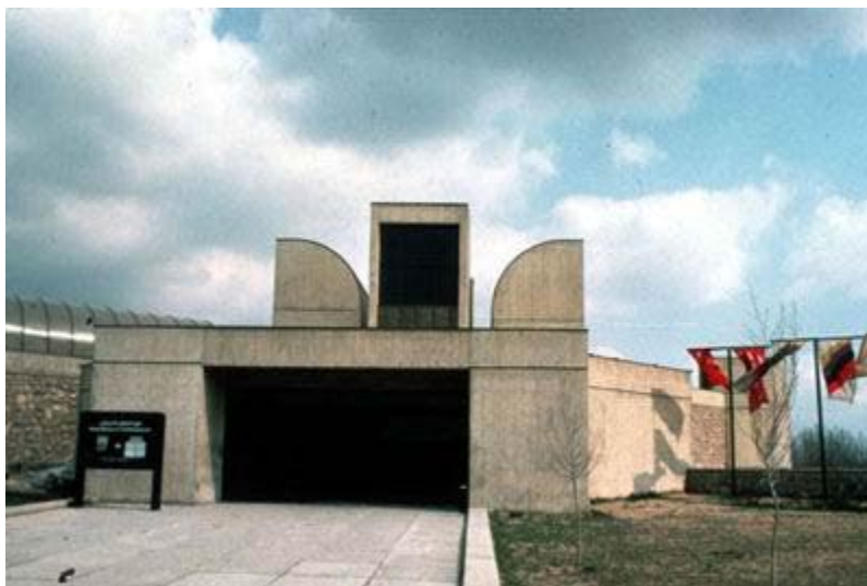
Museum of Contemporary Art, Tehran / Kamran Diba, 1976

دوره سوم معماری معاصر ایران همزمان با سال‌های آخر معماری مدرن است، دوره ای که معماری مدرن با چالش‌های جدی روبه‌روست و به تدریج یک جریئن تاریخ‌گرا در بطن آن شکل می‌گیرد. معماران ایرانی این دوره، همچون نادر اردلان، کامران د یها و حسین امانت، در پی پدیدآوردن آنثری بودند که پیوندی عمیق‌تر با معماری گذشته ایران برقرار سازند. آثار این معماران که از نمونه‌های خوب آنها می‌توان به مرکز آموزش مدییت، کار نادر اردلان و موزه