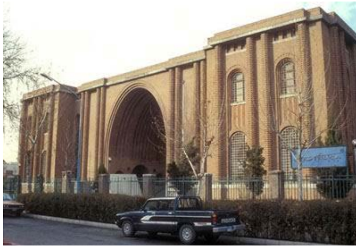
Archaeological Museum of Iran, Tehran / André Godard, 1939–1936

در این دوره، آثار مهم معماری غالباً به سفارش حاکمیت (پهلوی اول) و به دست معماران خارجی ساخته می‌شد، بناهایی با معماری حجیم و سنگین که در آنها سعی شده بود معماری گذشته ایران، به ویژه معماری دوران هخامنشی و ساسانی، مورد توجه قرار گیرد، توجهی صرفاً محدود به تکرار سطحی و ظاهری عناصر و شکل‌های بناهای عظیم و باشکوه معماری گذشته ایران. البته در این دوره کارهای دیگری رهن ساخته شدند که در آنها عناصری از معماری دوره اسلامی ایران با عناصری از معماری اروپایی در هم آمیخته شده بود. عمده آثار این دوره، بجز چند اثر معدود مانند موزه ایران باستان، کار آندره گدار، به رغم خلوص، استوار و استحکام‌شان، از ارزش چندانی، به لحاظ برقراری پیوندی عمیق با گذشته، برخوردار نیستند.